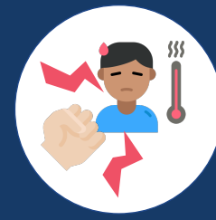
处分包括因使用带薪病假

在加州,如果您觉得自己的工作场所权利受到侵犯并采取行动或说出看法,雇主不能因您行使权利而处罚您。这叫报复,属于违法行为!