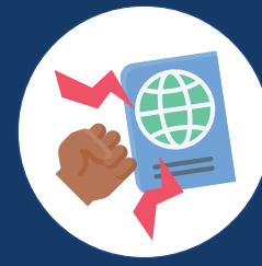
做出与移民身份相关的威胁